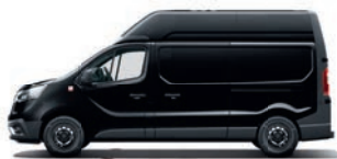
FURGONE A PANNELLI